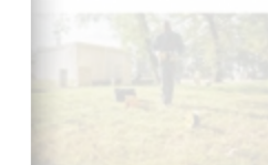
Réseau Protection Cathodique

➤ Découvrez la gamme de protection cathodique >