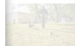
Réseau Protection Cathodique

ouvrez le domaine de protection cathodique >