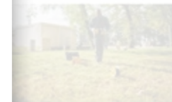
Réseau Protection Cathodique

ouvrez le carnet de protection cathodique >