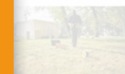
Réseau Protection Cathodique

Consultez la gamme de protection cathodique >