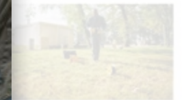
Réseau Protection Cathodique

Consultez la gamme de protection cathodique >