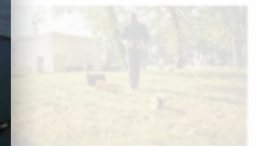
Réseau Protection Cathodique